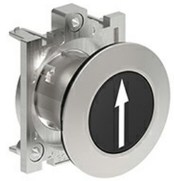
Operatori pulsanti ad impulso con simbologia LPFB11