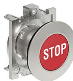
Operatori pulsanti ad impulso con simbologia LPFB11