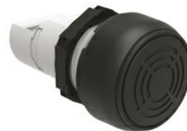
Ronzatore monoblocco - Suono continuo o intermittente LPCZS