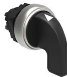
Operatori selettori leva lunga - 3 posizioni LPCS23