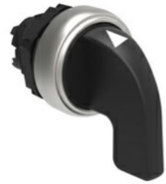
Operatori selettori leva lunga - 3 posizioni LPCS23