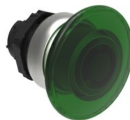
Operatore pulsante luminoso a fungo, ad impulso Ø 40mm LPCBL61