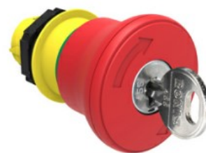
Operatore pulsante a fungo, ad aggancio sgancio a chiave Ø 40mm LPCB684