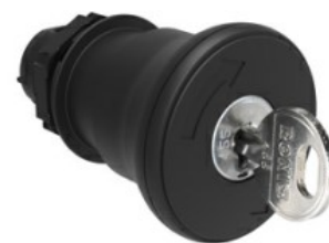
Operatore pulsante a fungo, ad aggancio sgancio a chiave Ø 40mm LPCB684