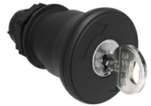
Operatore pulsante a fungo, ad aggancio sgancio a chiave Ø 40mm LPCB684