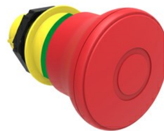
Operatore pulsante a fungo, ad aggancio sgancio a trazione Ø 40mm LPCB674