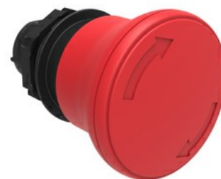
Operatore pulsante a fungo, ad aggancio sgancio a rotazione Ø 40mm LPCB634