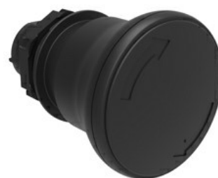
Operatore pulsante a fungo, ad aggancio sgancio a rotazione Ø 40mm LPCB634