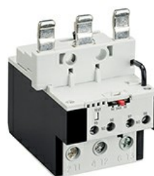
RFNA110 Releu protecție motor