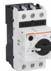
Intreruptor protecție motor SM1R