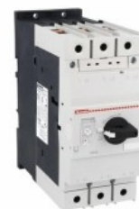
Wyłącznik silnikowy SM3R