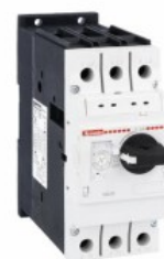
Wyłącznik silnikowy SM2R