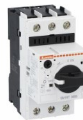
Wyłącznik silnikowy SM1RT