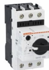
Wyłącznik silnikowy SM1RT