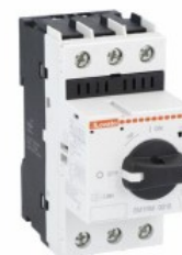
Wyłącznik silnikowy SM1RM