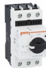
Wyłącznik silnikowy SM1RM