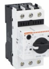
Wyłącznik silnikowy SM1R