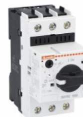
Wyłącznik silnikowy SM1R