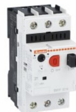
Wyłącznik silnikowy SM1P