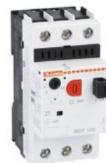
Wyłącznik silnikowy SM1P