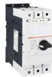
Salvamotori magnetotermici SM3R