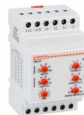
Relee de protecție a pompei PMA50