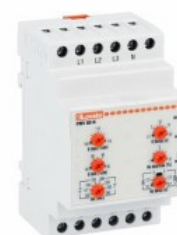
Przełączniki nadzorcze napięcia PMV80N