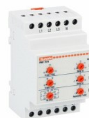
Przełączniki nadzorcze napięcia PMV70N