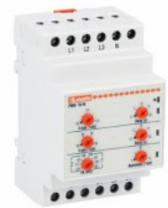
Przełączniki nadzorcze napięcia PMV70N