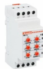
Przełączniki nadzorcze napięcia PMV70