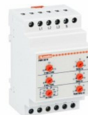
Przełączniki nadzorcze napięcia PMV50N