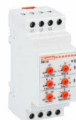
Przełączniki nadzorcze napięcia PMV50