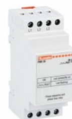
Przełączniki nadzorcze napięcia PMV20