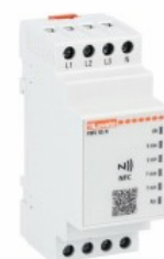
Relè multifunzione voltmetrici e frequenziometrici programmabili con tecnologia NFC PMV95N