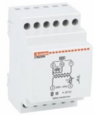
Trasformatori modulari di sicurezza CTRS AC 3