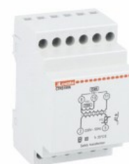
Trasformatori modulari di sicurezza CTRS AC 3