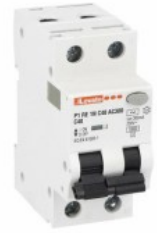
Residual current circuit breakers (RCCB) with overcurrent protection P1RE 1P+N 2 IEC