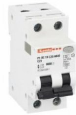
Residual current circuit breakers (RCCB) with overcurrent protection P1RE 1P+N 2 IEC