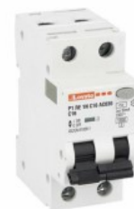
Residual current circuit breakers (RCCB) with overcurrent protection P1RE 1P+N 2 IEC