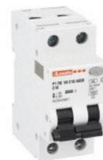
Residual current circuit breakers (RCCB) with overcurrent protection P1RE 1P+N 2 IEC