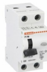
Înteruptor de curent rezidual cu protecție la supracurent (RCBO) P1 RB 1P+N 2 IEC