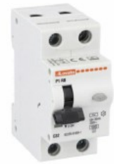
Înteruptor de curent rezidual cu protecție la supracurent (RCBO) P1 RB 1P+N 2 IEC