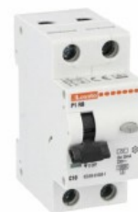
Înteruptor de curent rezidual cu protecție la supracurent (RCBO) P1 RB 1P+N 2 IEC