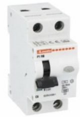
Înteruptor de curent rezidual cu protecție la supracurent (RCBO) P1 RB 1P+N 2 IEC