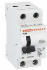
Înteruptor de curent rezidual cu protecție la supracurent (RCBO) P1 RB 1P+N 2 IEC