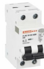
Residual current circuit breakers (RCCB) with overcurrent protection P1RE 1P+N 2 IEC