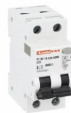
Residual current circuit breakers (RCCB) with overcurrent protection P1RE 1P+N 2 IEC