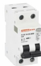
Residual current circuit breakers (RCCB) with overcurrent protection P1RE 1P+N 2 IEC