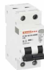
Residual current circuit breakers (RCCB) with overcurrent protection P1RE 1P+N 2 IEC