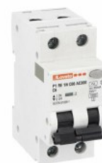
Residual current circuit breakers (RCCB) with overcurrent protection P1RE 1P+N 2 IEC